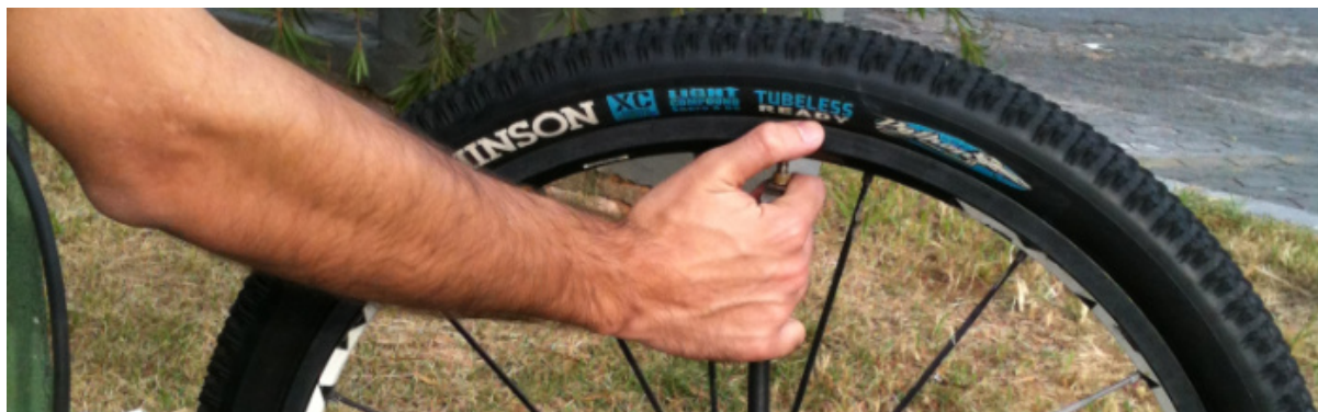
Figura 1.3 – Enchimento inicial

Com o pneu montado, o mesmo deve ser inflado na roda com auxílio de um compressor.