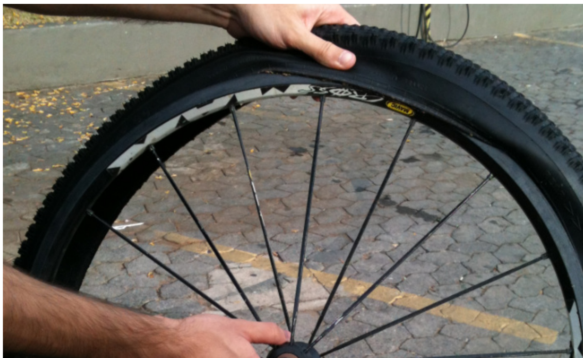
Figura 1.2 – Montagem preliminar

Com o pneu montado, o mesmo deve ser inflado na roda com auxílio de um compressor.