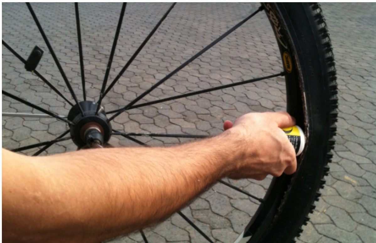
Figura 1.4 – Inserção do Selante HT

Uma vez aprovada a montagem inicial, o pneu deve ser esvaziado para que o selante possa ser inserido na roda. Com pneu vazio, abra uma pequena aba entre o pneu e o aro para que o selante possa ser inserido no interior da roda.