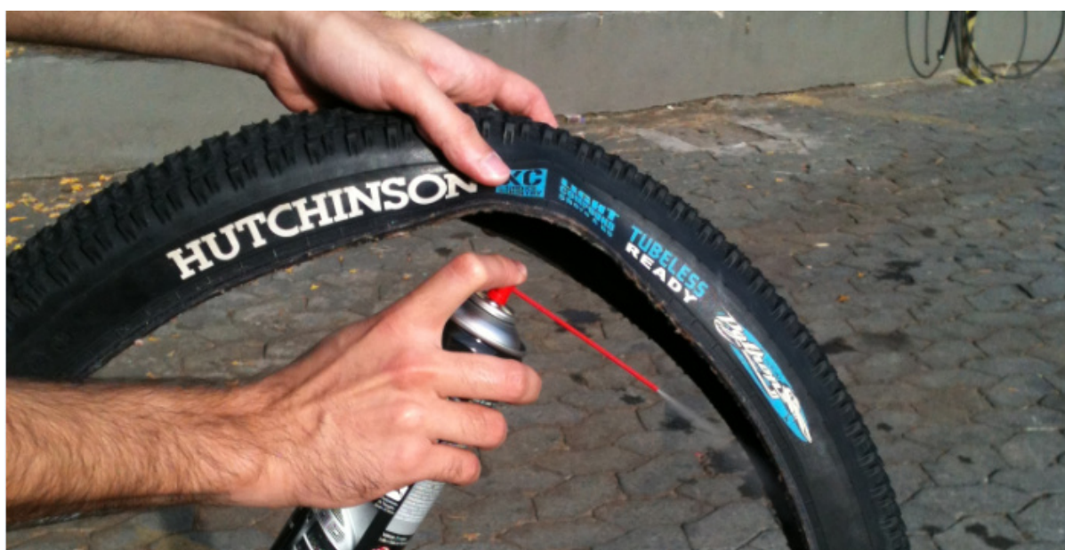
Figura 1.1 – Aplicação de silicone em spray

Para facilitar a remoção futura do selante após sua solidificação, é recomendada a aplicação de Silicone em Spray no interior do pneu antes da instalação. IMPORTANTE: Nunca substitua o uso do silicone por óleos em spray do tipo WD40® ou Superlub®. Eles podem reagir com selante e formar lacas de vernizes.